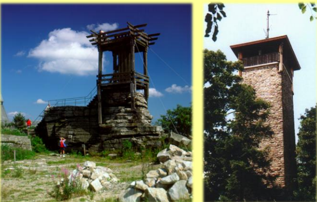
links: Backöfele auf dem Schneeberg, 1053 m ü. NN / rechts: Weissensteinturm

Unser am Hügel gelegenes Dorf hat etwa 150 Einwohner. Am Ortsrand befindet sich unser traditioneller Bauernhof mit dem in Ziegelbauweise nach ökologischen Gesichtspunkten errichtetem Gästehaus mit Ausblick auf Waldstein, Schneeberg und Ochsenkopf.